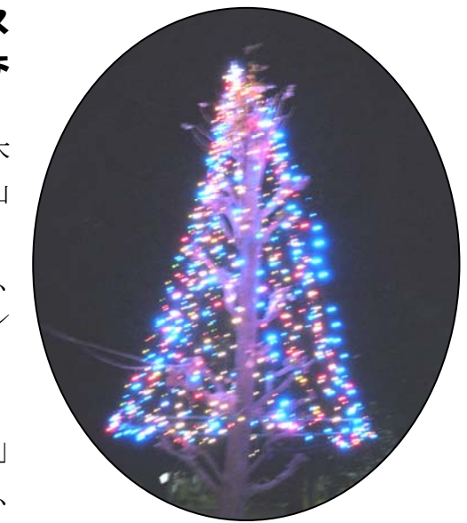
(昨年のイルミネーション)

いくつになってもこういうものを見ると、なんとなくきうきしてくるものです。また有志の方々が頑張ってくれますので、約1ヶ月、みんなで楽しませていただきます。